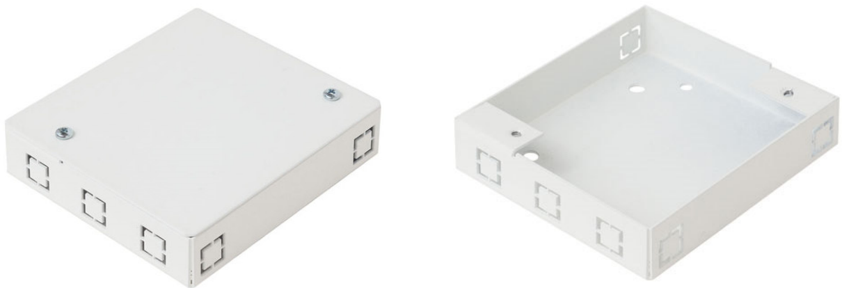
Рисунок 1 - Общий вид коммутационной коробки КК-2757

1.2 Общий вид коммутационной коробки, показан на рисунке 1.